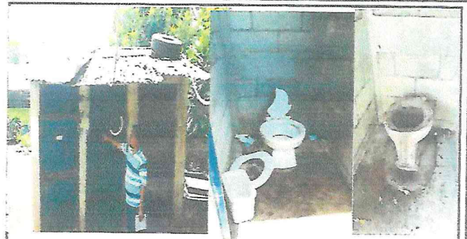
Foto 2: El techo de los baños se encuentra en muy mal estado, así como de las puertas y los inodoros que requieren sustitución