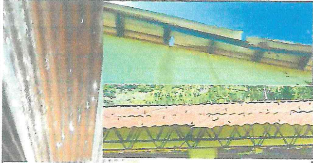
Foto 1: El techo de un salón se encuentra en mal estado por antigüedad y el del otro edificio se dañó por la caída de un árbol.