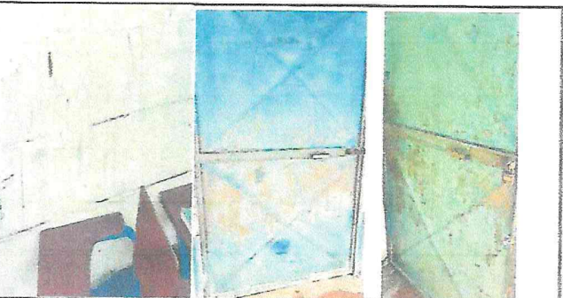
Foto 5: La pintura en muros interiores y exteriores en mal estado así como las puertas requieren mantenimiento.-